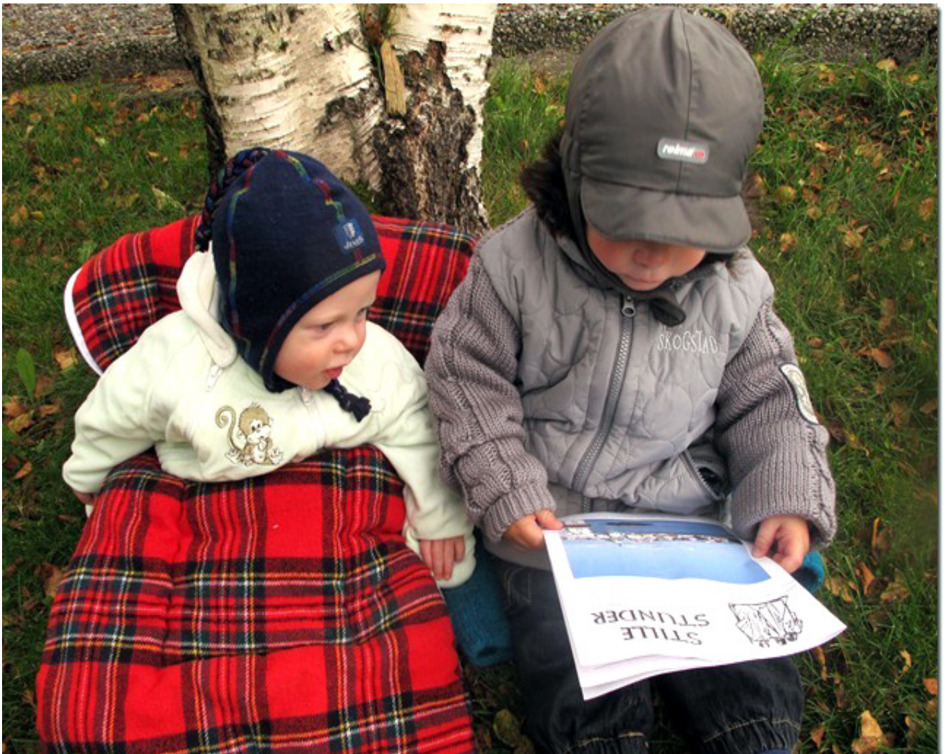
Den må tidleg krøkjast....som god Stille Stunder-lesar skal verta.